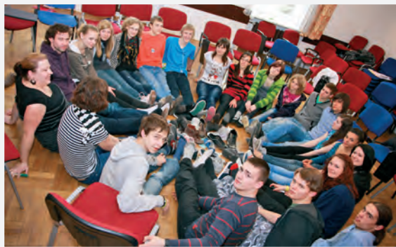
Mezinárodní workshop v polském Krakově

Významnou mezinárodní událostí bylo setkání vybraných školních týmů v polském Krakově. Pedagogové zde měli možnost porovnat činnost jejich školy s ostatními, dozvědět se, jak začleňují globální rozvojové vzdělávání do výuky v jiných evropských zemích, a vyzkoušet si nové aktivity využitelné ve vý-