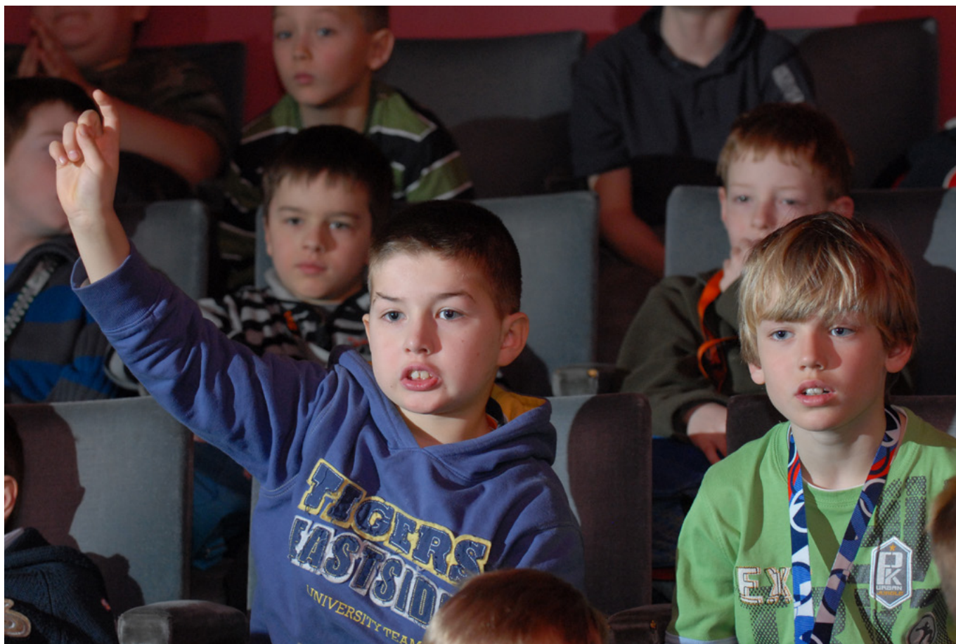
Projekt Jeden svět na školách organizace Člověk v tísni .

Evropská komise (EK) je významným poskytovatelem financí prostřednictvím tematického programu pro nestátní aktéry a místní municipality, od roku 2014 vyhlašovaného jako Civil Society Organisations and Local Authorities. EK stanovila dva strategické cíle – přidaná hodnota a doplnkovost k aktivitám v oblasti GRV a osvěty na úrovni členských států a zaměření na klíčové globální otázky. Klade velký důraz na pan-evropský charakter projektů, z čehož vznikají velké projekty na úrovni více zemí. České NNO se ve srovnání s jinými zeměmi EU dosud řadily mezi ty neúspěšnější. Nicméně konkurence projektů je obrovská a roste i jejich organizační náročnost.