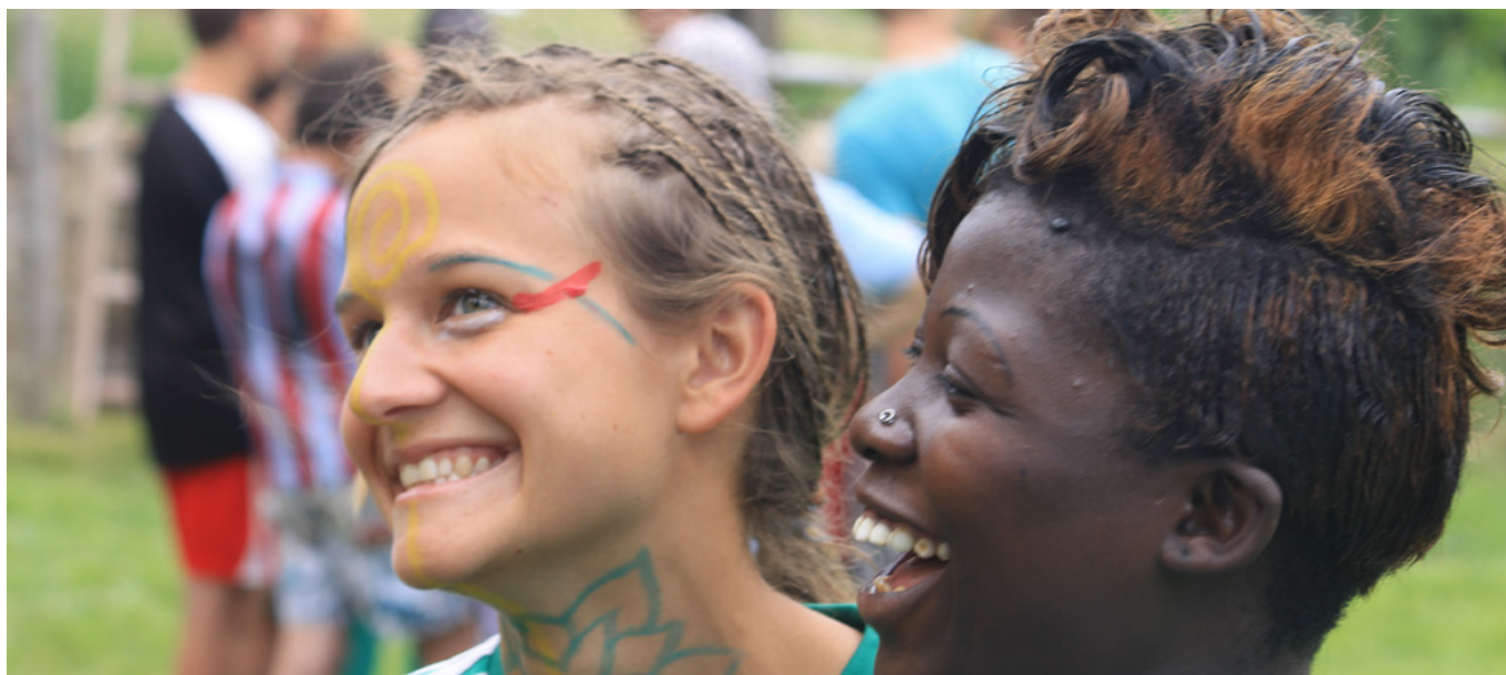
Projekt Fotbal pro rozvoj organizace INEX-SDA . Autor Tornike Toradze .